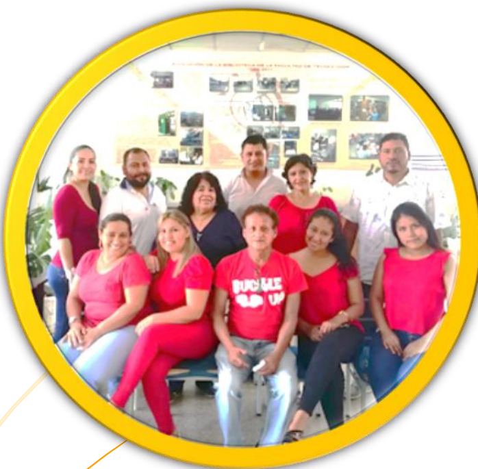
PERSONAL GESTIÓN 2021