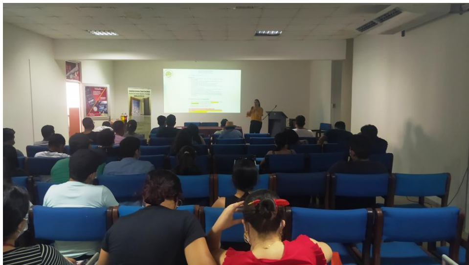
Charla de inducción para estudiantes de la FCET en el auditorio de la Videoteca 2º piso