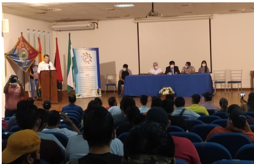
Inauguración de las Maestrías gratuitas en el Auditorio principal planta baja

Este 2021 no se registraron préstamos de multimedia.