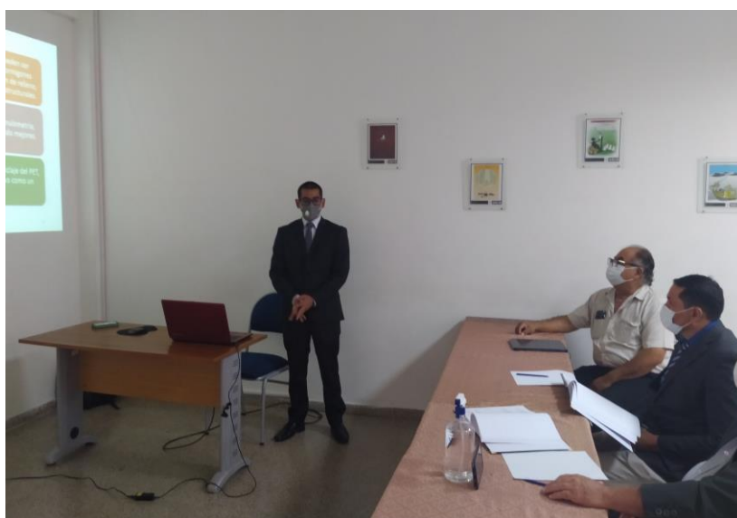
Defensa tesis Ing. Civil sala 3