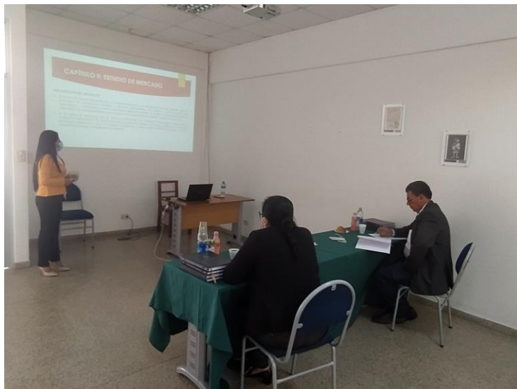
Defensa tesis Ing. Industrial sala 2

En total el 2021 se han registrado 185 actividades tanto en los auditorios como en las diferentes salas que tiene la BT.