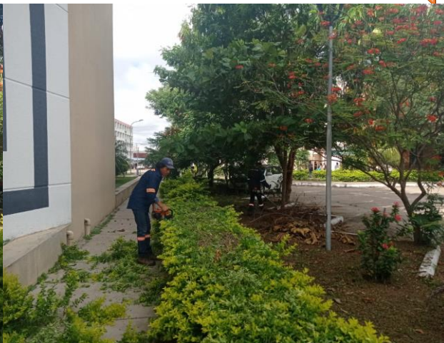
Durante el trabajo