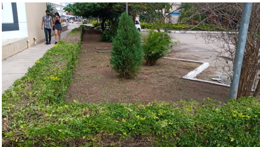
Trabajo concluido de las áreas verdes

La proliferación de mosquitos y otras plagas propias de la época, hacen que la biblioteca debe ser fumigada por lo menos dos veces al año es así que en el mes de agosto logramos que la DIEU pueda apoyar con la fumigación de la BT.