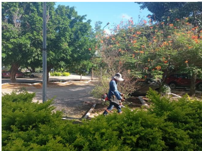
Antes del trabajo